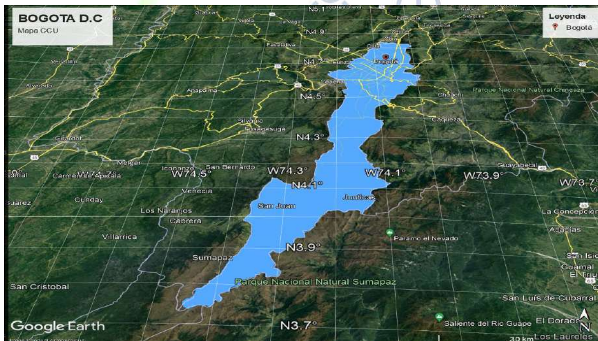
Ilustración 1 Área de prestación Bogotá