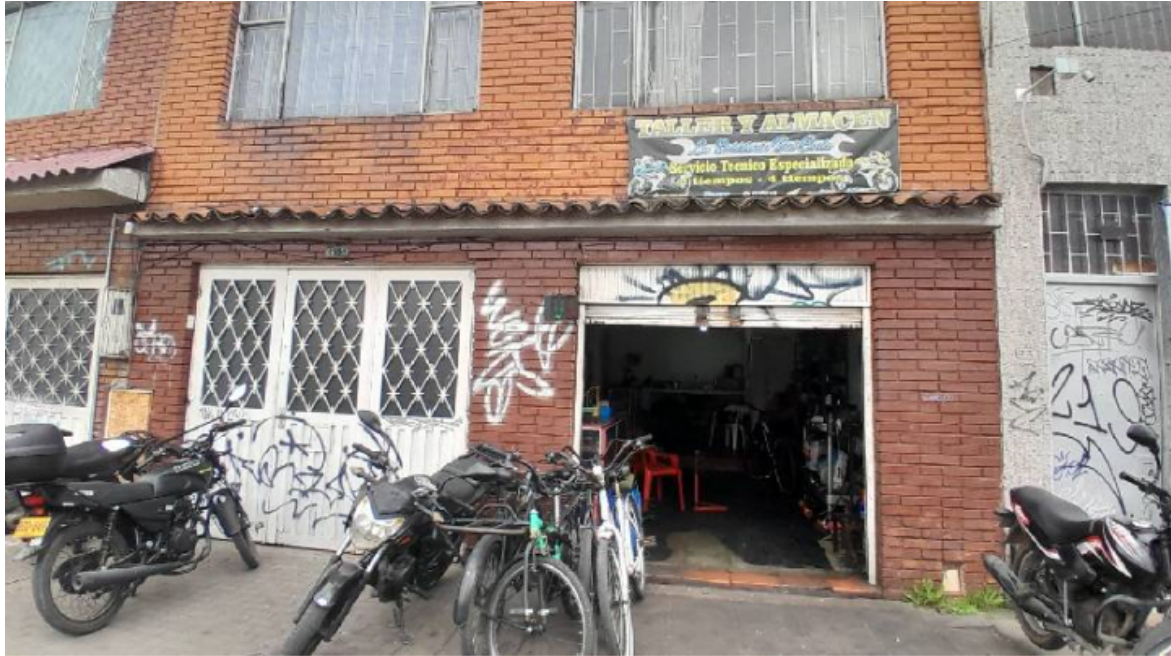
Cuenta contrato : 10457510 - Foto # 1 del 2024-07-25 Image 4 of 10

Es por lo anterior, que en relación a sus pretensiones, nuestra compañía no las encuentra procedentes ya que en el registro fotográfico que se le realizó al predio se evidencia con veracidad que si existen las unidades asignadas para la cuenta contrato.