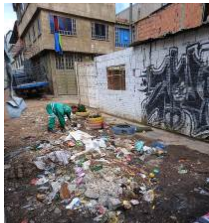
Bogotá, Bogotá, Colombia Cra. 81j #41-47, Bogotá, Colombia Lat: 4.6277983 / Long: -74.1867503 martes 05 agosto 2024 08:21:22

No obstante, se reitera que se debe recurrir a la aplicación normatividad del caso, en las acciones de las autoridades locales y distritales, por medio de los seguimientos en dichas zonas para realizar la respectiva aplicación de los comparendos Ambientales según lo establecido en el decreto distrital 349 de 2014 artículo 13 parágrafo “en caso de denuncias, las autoridades mencionadas en este artículo (los miembros de la policía nacional, los agentes de tránsito, los inspectores de policía y los corregidores como autoridades investidas legalmente para imponer el comparendo) se desplazarán hasta el lugar de los hechos y constatarán el grado de veracidad de la denuncia, y de resultar positiva procederán a aplicar el comparendo ambiental si se evidenciara el responsable de tal conducta.