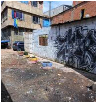
Bogotá, Bogotá, Colombia Cra. 81j #41-47, Bogotá, Colombia Lat: 4.6277962 / Long: -74.1867503 martes 05 agosto 2024 09:35:44