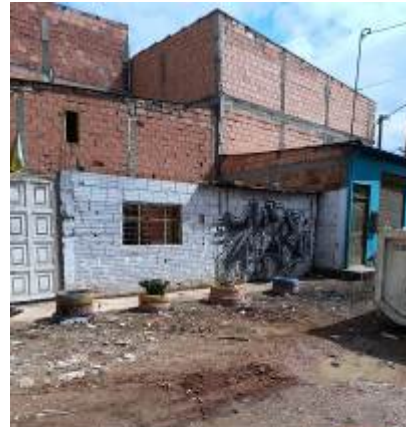
Bogotá, Bogotá, Colombia Cl. 41 Sur #61h-26, Bogotá, Colombia Lat: 4.6266514 / Long: -74.1845793 martes 05 agosto 2024 09:36:06