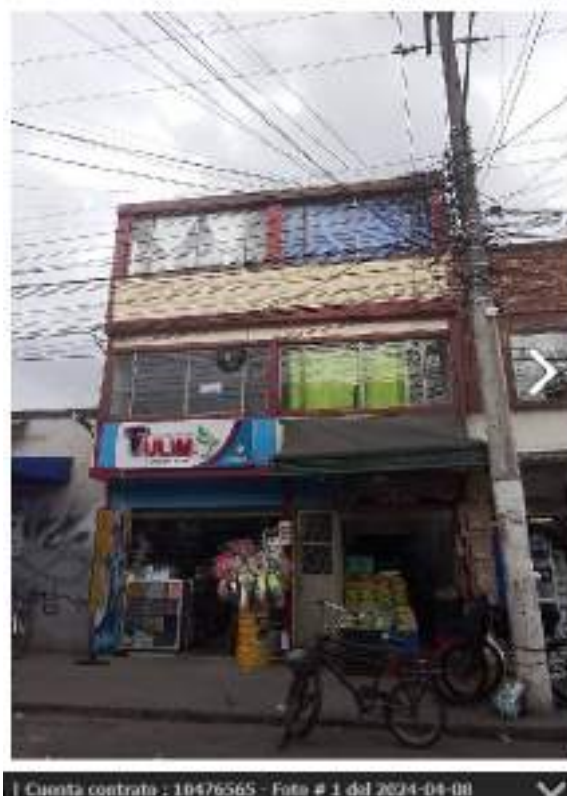
Cuenta contrato : 10476565 - Foto # 1 del 2024-04-08

En suma, de lo mencionado se clara que lo valores facturados se han generado de acuerdo con la metodología tarifaria vigente por ende respetan todo el prospecto constitucional y legal citado por el recurrente, esto ya ha sido dicho en todas las decisiones emitidas por esta prestadora, por último, se dispone registro fotográfico del inmueble visitado: