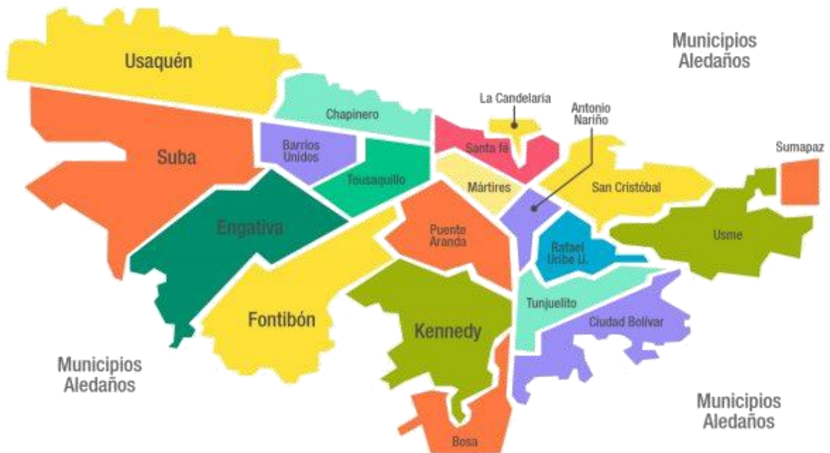
IMAGEN 1. ÁREA DE PRESTACIÓN DEL SERVICIO ARPAL

El área de prestación en la ciudad de Bogotá corresponde al área urbana del mismo, la cual se encuentra dividida en 20 macro rutas, las cuales son realizadas con vehículos, recicladores de oficio y operarios. En el caso de las micro rutas son realizadas por los recicladores con una frecuencia diaria los 7 días de la semana.